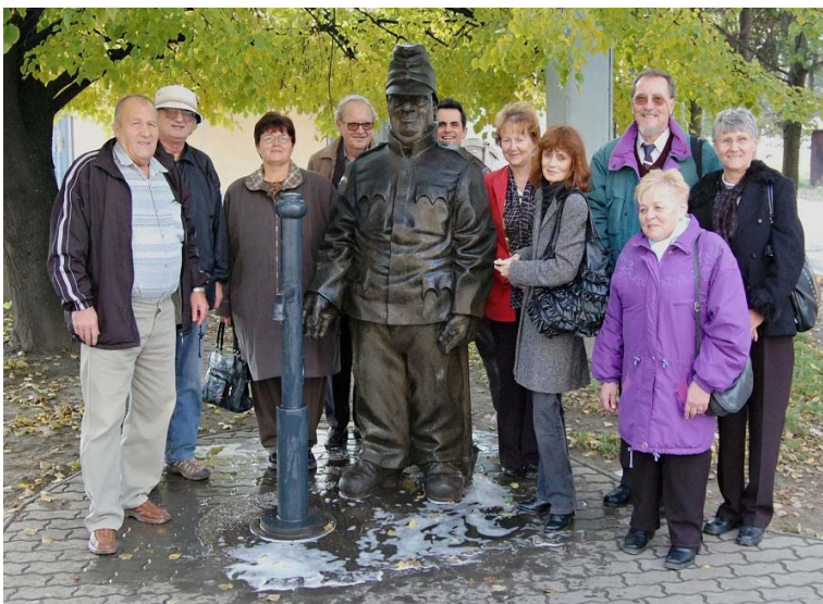
A Český spolok és a CSEMADOK tagjai a „Švejk a jó katona“ szobornál, fürdés után a Homonnai vasútállomáson