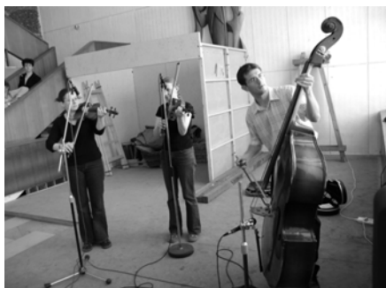
A Gyeplős zenekar