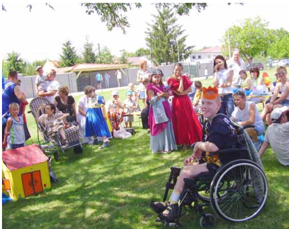
V sobotu 21. júna 2008 sa v Blatnom/okres Senec/konal Veľký futbalový turnaj a-ha cup. Tento deň bol tiež Veľkým letným stretnutím všetkých členov Nezábudky – občianskeho združenia na pomoc rodinám so zdravotne postihnutými deťmi z Turne.

Povinná akreditácia dobrovoľníckych organizácií, hoci by mohla priniesť automatickú podporu zo strany štátu, nie je žiaduca, pretože